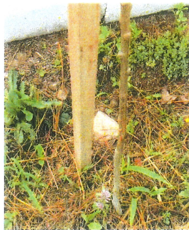
Figura 6 – Detalhes dos cortes realizados pelas roçadeiras nas mudas.