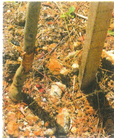
Figura 4 – Detalhes dos cortes realizados pelas roçadeiras nas mudas.