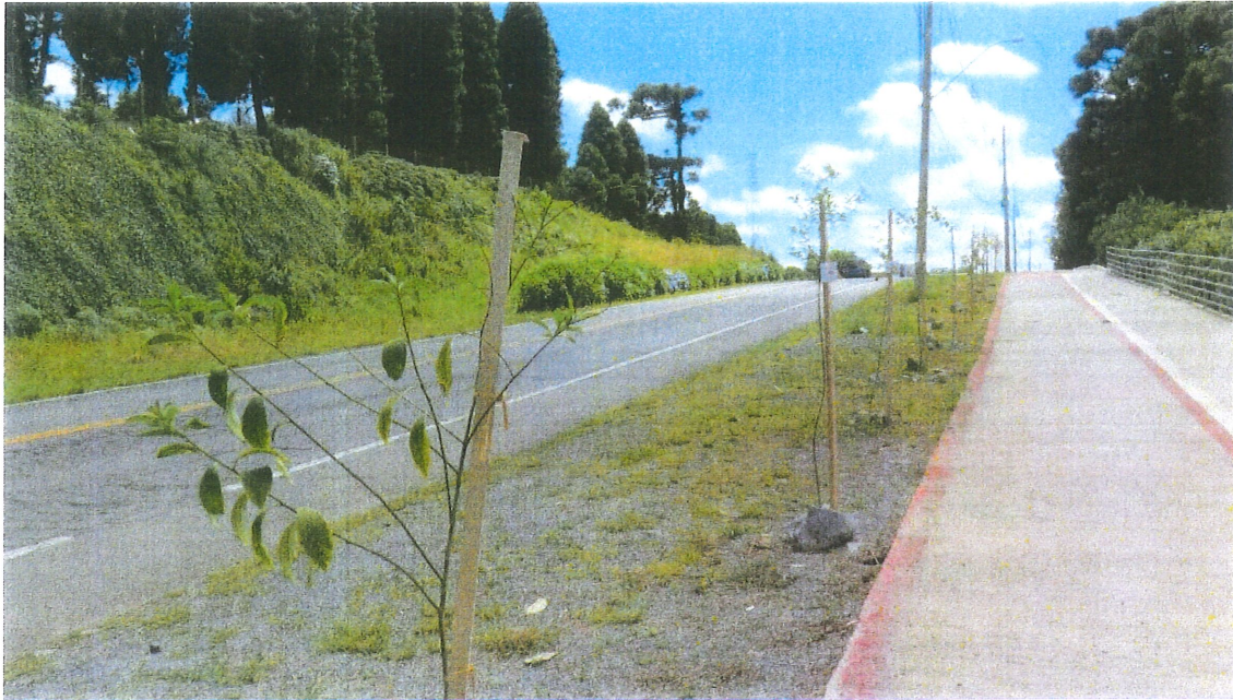
Figura 2 – Vista geral das mudas com porte médio e bom desenvolvimento.