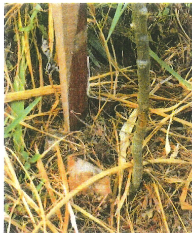
Figura 5 – Detalhes dos cortes realizados pelas roçadeiras nas mudas.