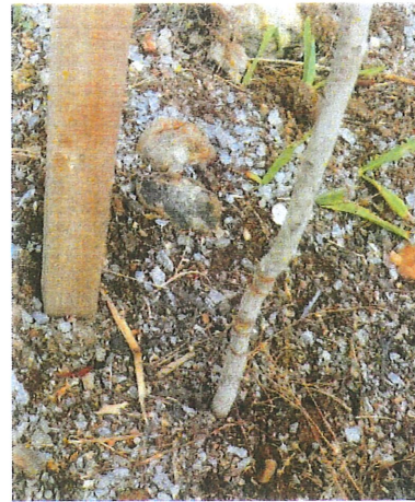
Figura 3 – Detalhes dos cortes realizados pelas roçadeiras nas mudas.