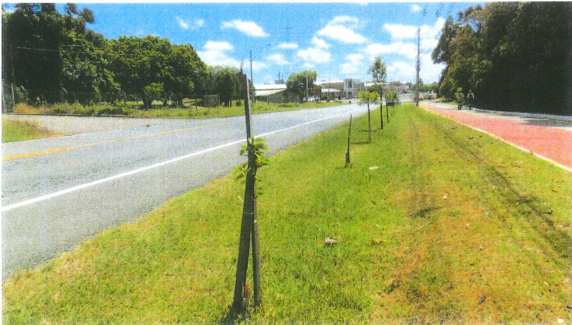
Figura 1 – Vista geral do plantio de mudas onde foi realizada a roçada das gramíneas.